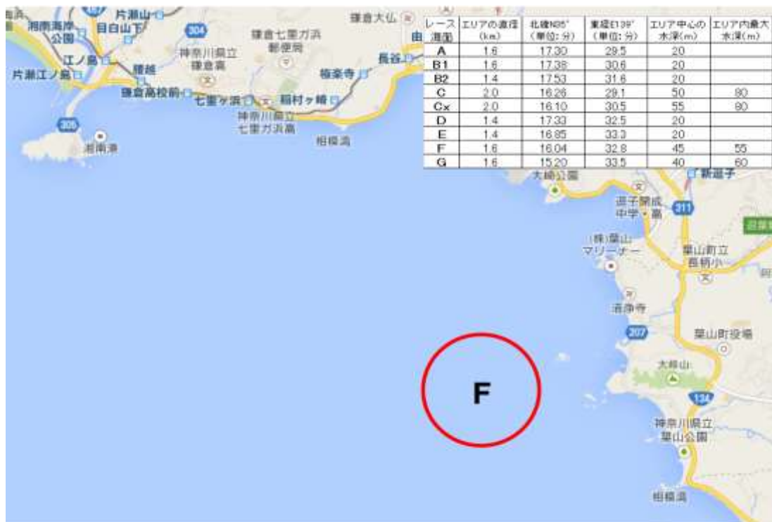
【添付図 B】 レース・エリア